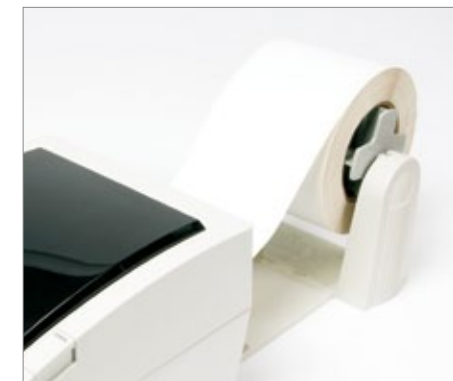
Grande variedade de opções, incluindo um suporte externo para o papel.