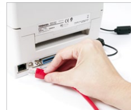
Inclui de serie interface de rede LAN 10/100Mbps.