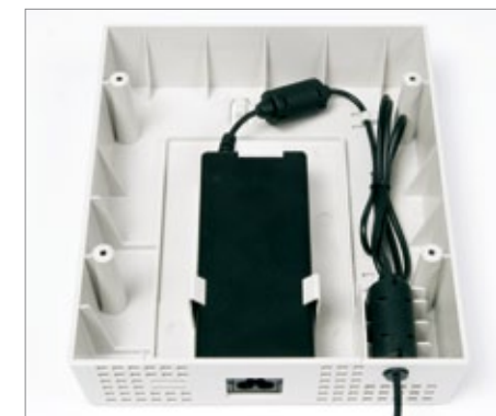
Tampa opcional para a fonte de alimentação.